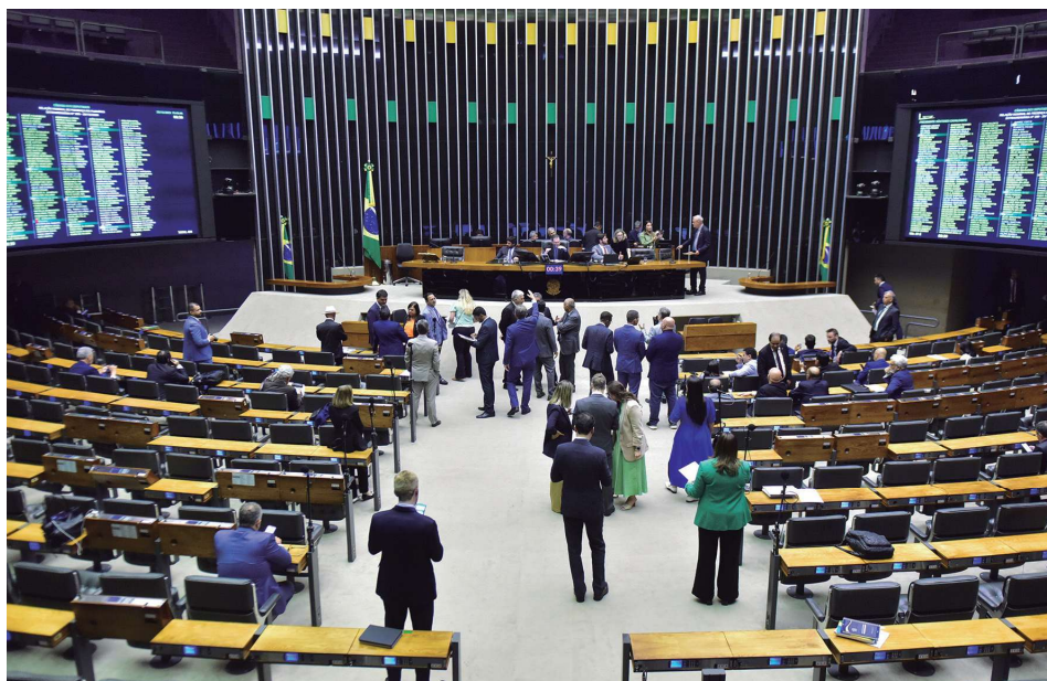
DISCUSSÃO E VOTAÇÃO DAS PROPOSTAS NA SESSÃO DE 20 DE DEZEMBRO DE 2023

A Câmara dos Deputados promulgou, no dia 20 de dezembro de 2023, a Emenda Constitucional 132 da reforma tributária, com a inclusão de um dispositivo nos artigos 155 e 156 que garante a autonomia financeira das universidades públicas paulistas – USP, Unesp e Unicamp.