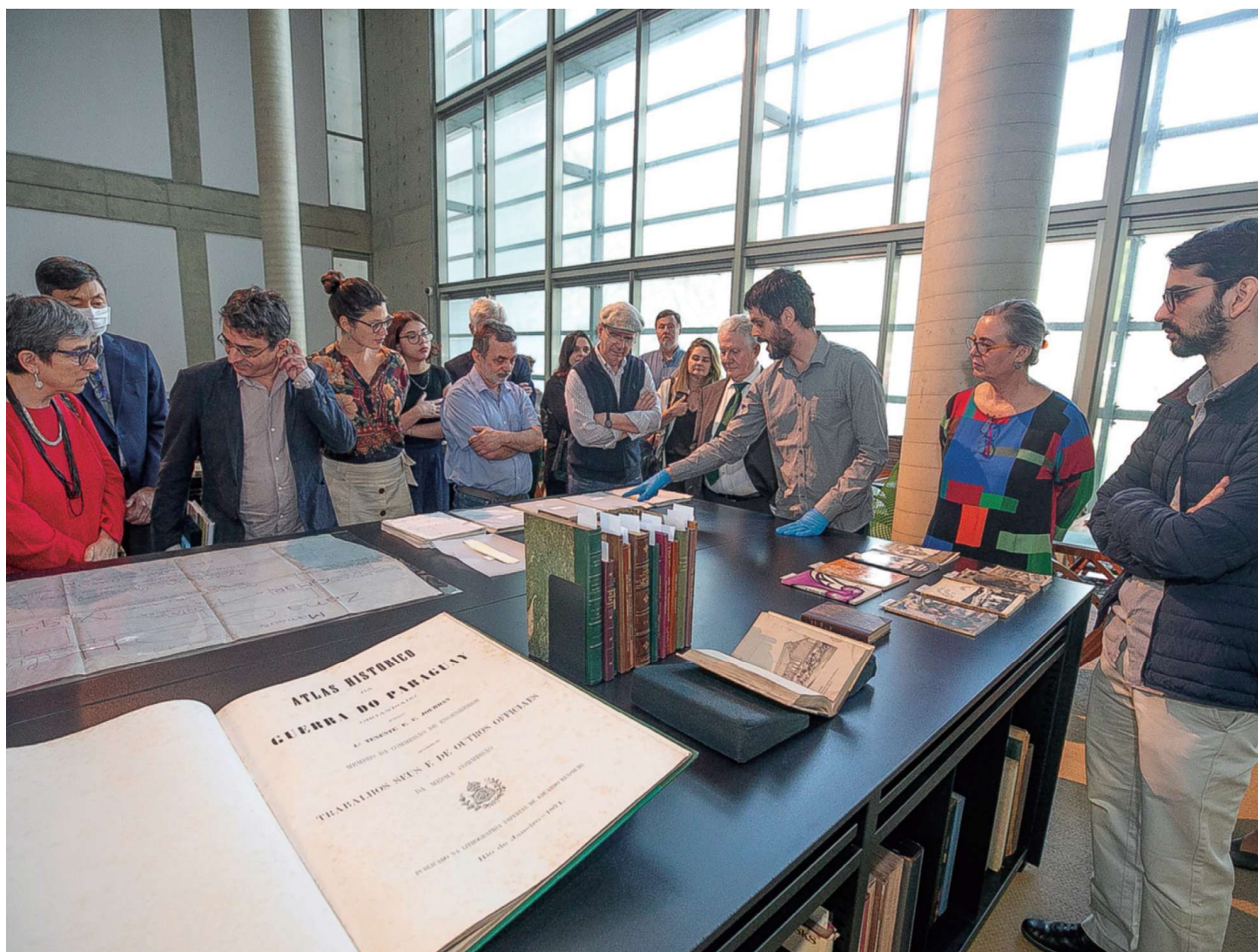
ENCONTRO COM DOADORES DO FUNDO PATRIMONIAL NA BIBLIOTECA BRASILIANA